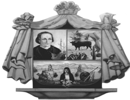
PRESIDENCIA MUNICIPAL COLÓN, QRO.